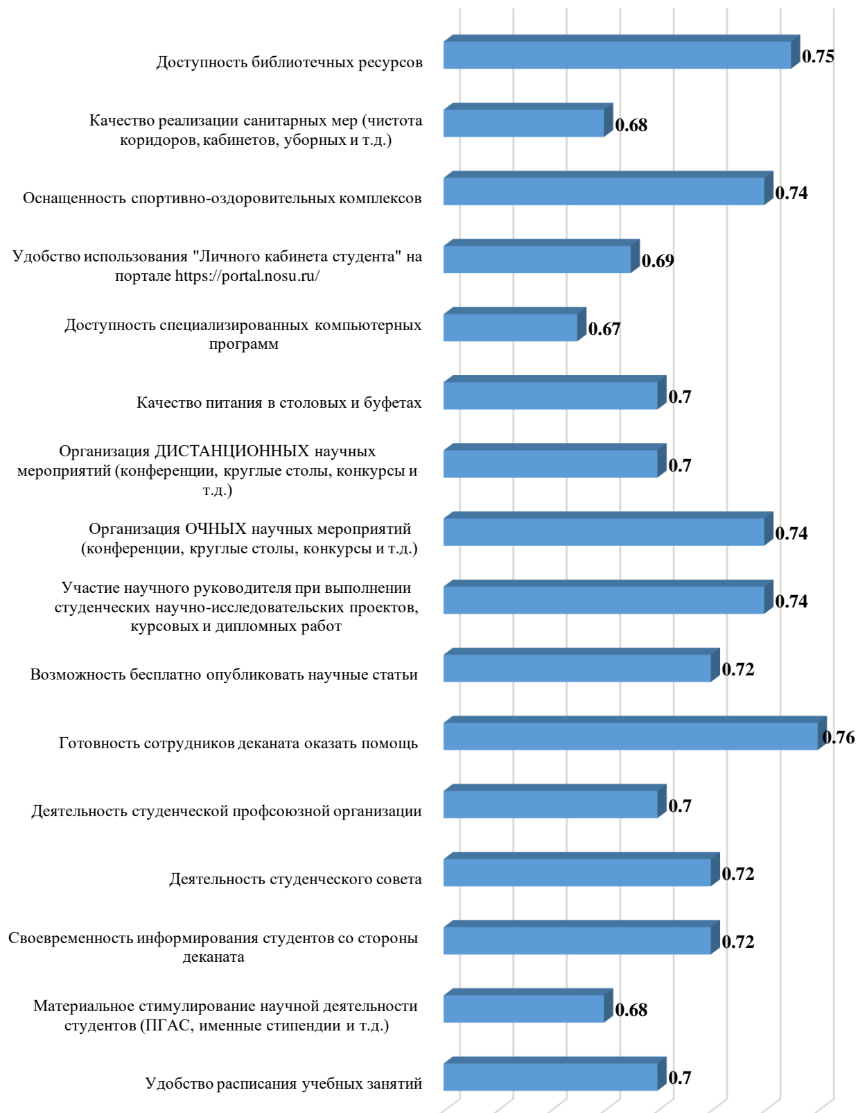
Рисунок 3. Индекс удовлетворённости различными аспектами, поддерживающими процесс обучения в СОГУ