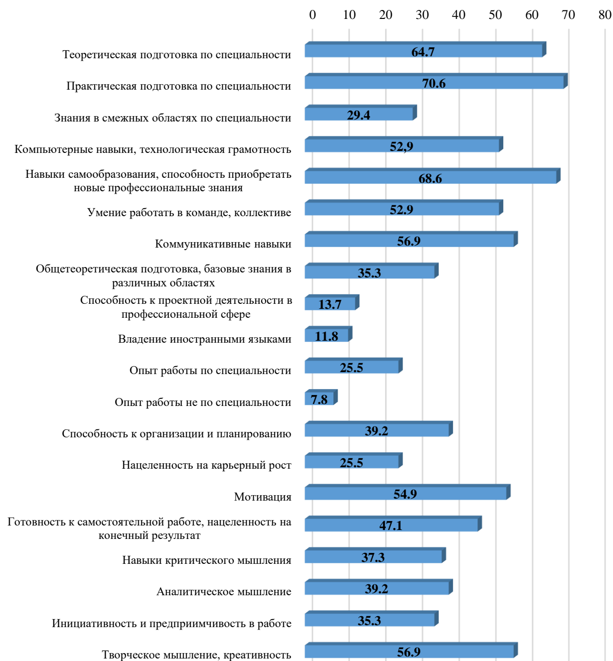
Рисунок 3. Какие из нижеперечисленных навыков, качеств оказывают наибольшее влияние на эффективность профессиональной деятельности специалиста? (%)

В основную группу навыков (качеств), оказывающих наибольшее влияние на эффективность профессиональной деятельности специалиста в сфере конституционного и муниципального права, по мнению работодателей, входят: практическая подготовка по специальности (70,6%), навыки самообразования (68,6%), теоретическая подготовка по специальности (64,7%), творческое мышление, креативность (56,9%), коммуникативные навыки (56,9%), мотивация (54,9%), технологическая (компьютерная) грамотность (52,9%) и умение работать в команде, коллективе (52,9%).