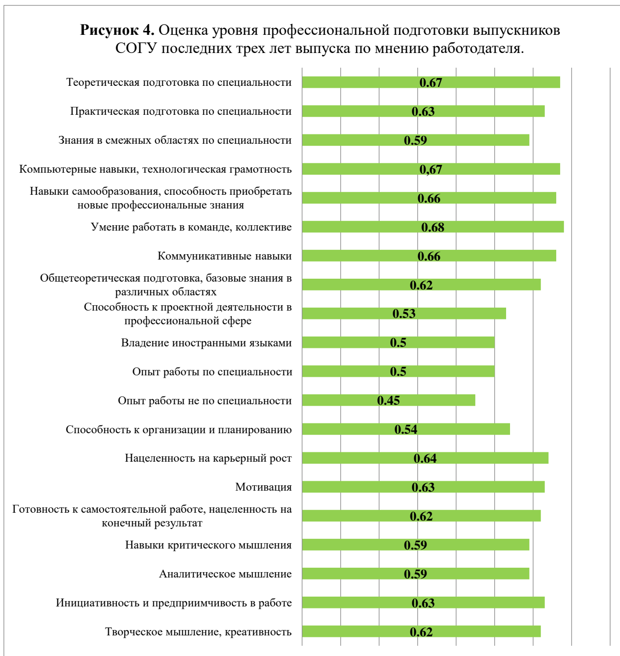
Рисунок 4. Оценка уровня профессиональной подготовки выпускников СОГУ последних трех лет выпуска по мнению работодателя.

Работодатели дают оценку выше среднего уровня профессиональной подготовки работающих у них выпускников СОГУ последних трех лет выпуска профиля «Конституционное право; муниципальное право» согласно критериям на рисунке 4*. Самые высокие значения индекса получены по критерию «Умение работать в команде, коллективе» - i=0,68 , а также «Теоретическая подготовка» ( i=0,67 ) и «Технологическая (компьютерная) грамотность» ( i=0,67 ). Ниже всего работодатели оценивают «Опыт работы не по специальности» ( i=0,45 ), «Опыт работы по специальности» ( i=0,5 ) и «Владение иностранными языками» ( i=0,5 ).